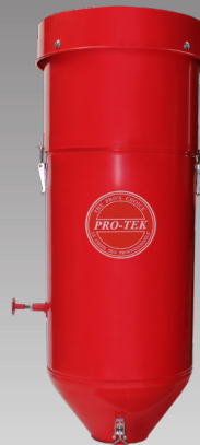
SBC-350-56 Vacuum / Aspirateur / Aspirador