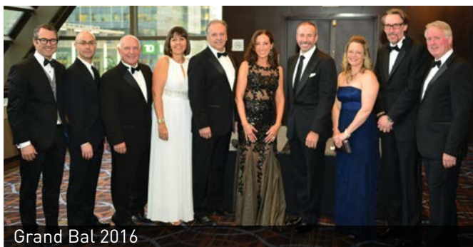
Grand Bal 2016

Inspirée par sa devise « Construire l'avenir avec les jeunes », la Fondation a choisi d'utiliser son expertise et d'investir principalement dans les besoins immobiliers d'organisations montréalaises qui ont pour mandat d'aider les jeunes.