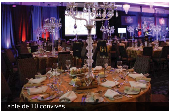
Table de 10 convives