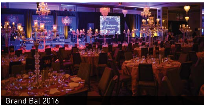
Grand Bal 2016